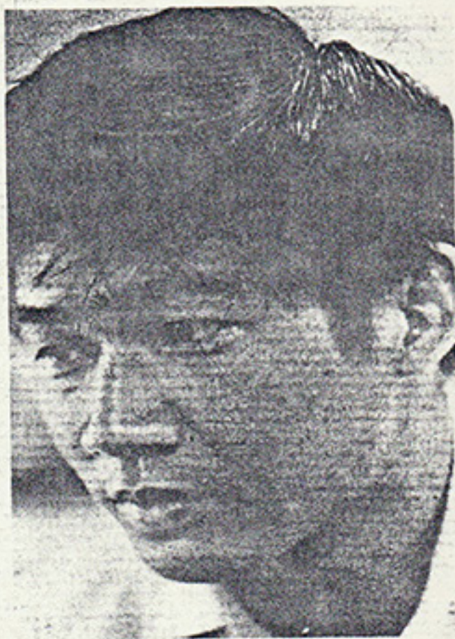
CHEN... holding exhibition

"The Chinese art does not depend much on colour; it relies a lot on the shades and tones produced by the brush," he said.