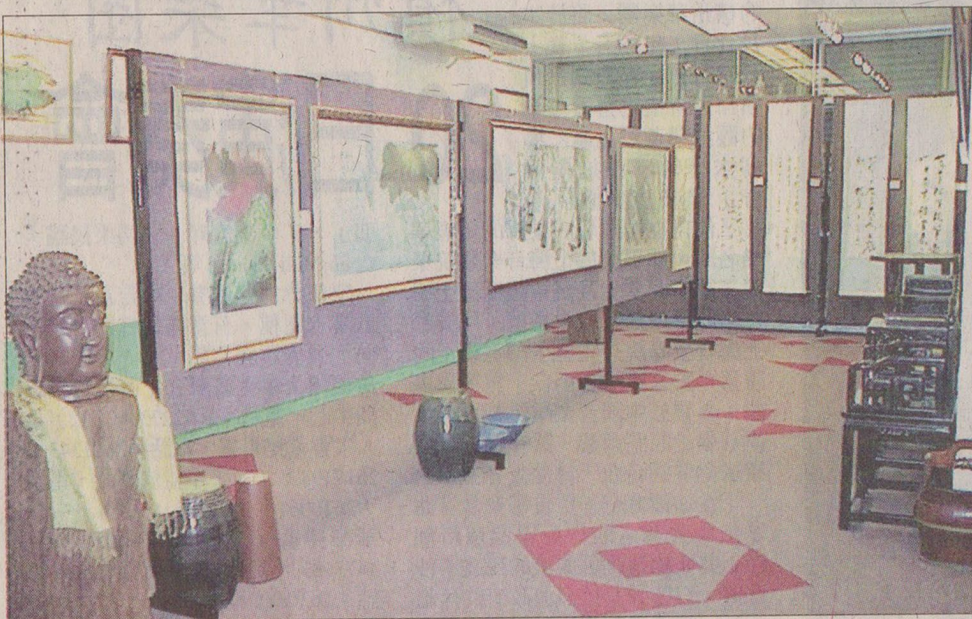
■威南第一個畫展，五十餘幅名家畫供賞，豈能錯過？

「這樣不單能提升本身的文化水平，同時也間接提升地方性居民的文化修養，通過文物展覽館主辦各種活動，為喜愛藝術