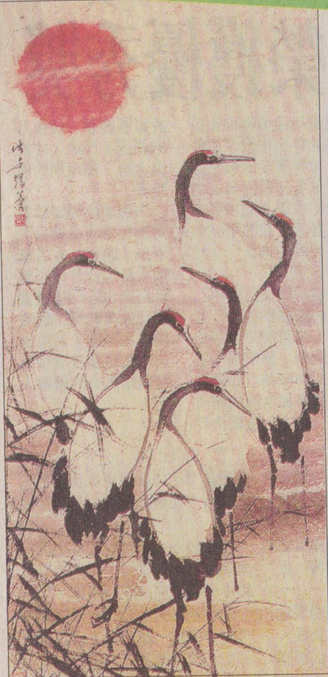
■鄭浩千作品首次在威南展出，喜愛水墨畫的朋友萬勿錯過。