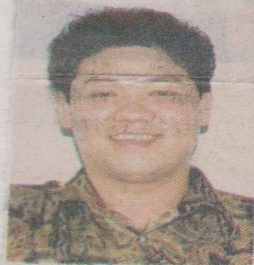
高洲区国会议员吴庆发。