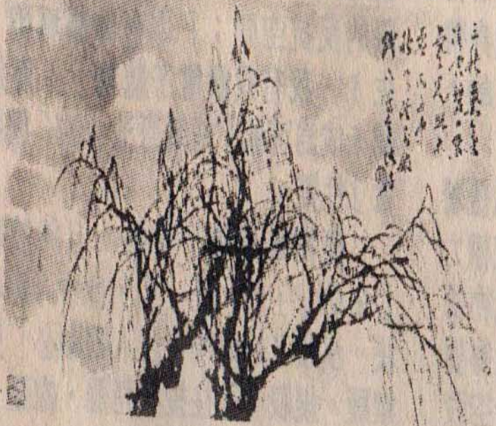
↑鄭浩千作品：寒光照太虛。