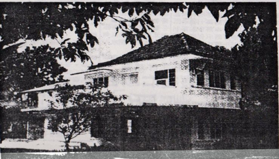
吉隆坡中央藝術學院前景，地方幽美，是培養藝術種籽的溫床